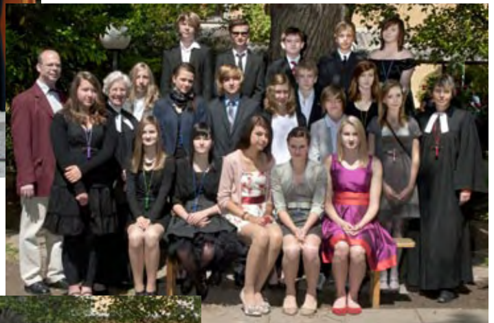
Heilandskirche 29. 5. 2011