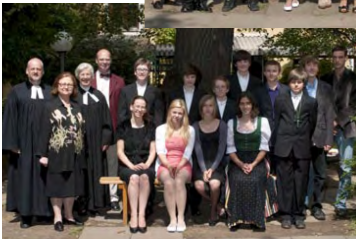
Heilandskirche 5. 6. 2011

Sei getrost und fürchte dich nicht, geh deinen Weg mit Gott!