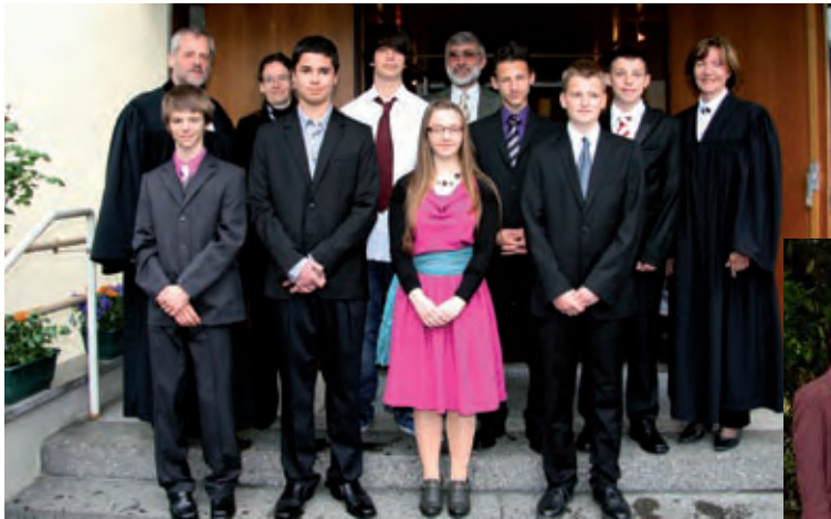
Erlöserkirche 15. 5. 2011