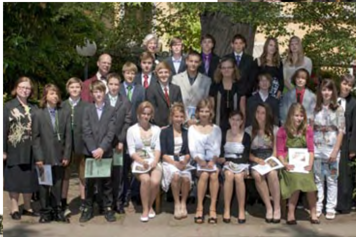
Heilandskirche 2. 6. 2011

Sei getrost und fürchte dich nicht, geh deinen Weg mit Gott!